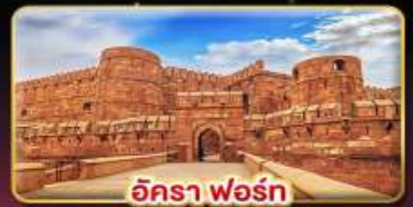
อัครา ฟอรั่ม