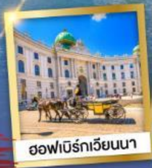
ชอฟเบิร์กเวียนนา