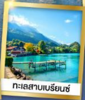
ทะเลสาบเบรีนซ์