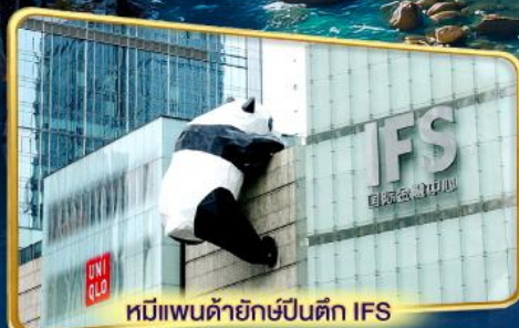
หมีแพนด้ายักษ์ปีนตึก IFS