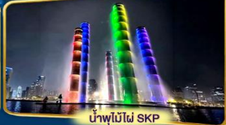
น้ำพุไม้ไผ่ SKP