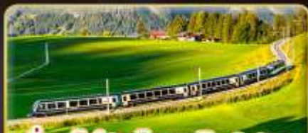
นั่งรถไฟสายโรแมนติก 2 สาย Golden Pass / Luzern Interlaken Express