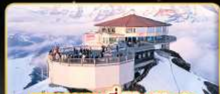
ทานอาหารที่ Piz Gloria ทัศนียภาพที่มุมได้ 360 องศา