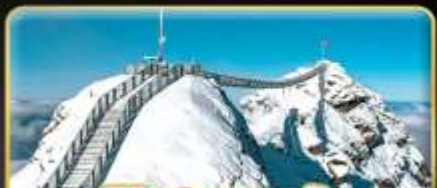
พิชิต 3 ยอดเขาดัง Rigi / Schilthorn / Glacier 3000