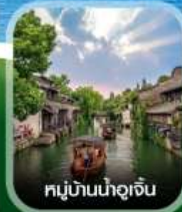
หมู่บ้านน้ำอู๋เจิน