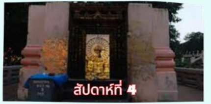
รัตนขรเจดีย์ (ซุ้มเรือนแก้ว)

เรียบร้อยแล้ว นำคณะจาริกบุญสวดมนต์ทำวัตรเย็น บูชาพระรัตนตรัย และสวดมนต์บูชาสังเวชนียสถาน จากนั้นเชิญท่านทำศนาธรรม นั่งสมาธิปฏิบัติบูชาตามอัยาศัย สมควรแก่เวลา นัดหมายเวลาเชิญท่านกลับโรงแรมที่พัก