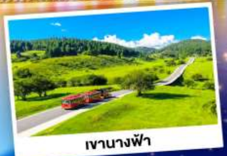
เจานางฟ้า