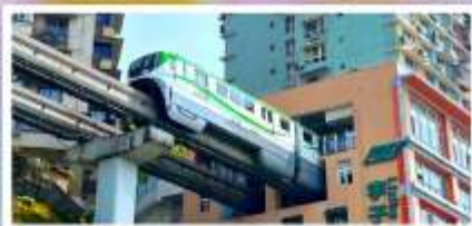
รถไฟฟ้าลู่ตึก