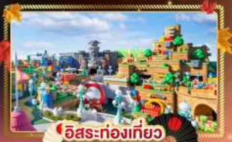
อิสระท่องเที่ยว