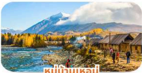
หมู่บ้านเหม่อ