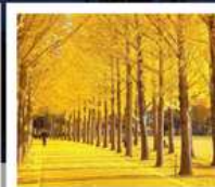
สวนเอ็กซ์โป