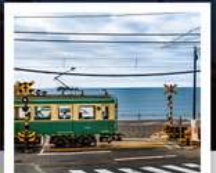
รถไฟโอบะเด็น