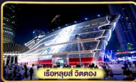
เรือลู่ส์ วัดตอง