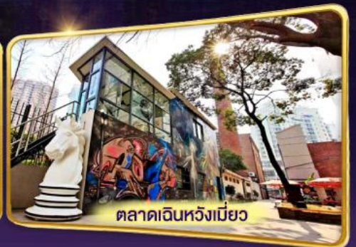
ตลาดเงินหวังเมี่ยว