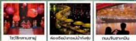
โชว์ลีลาหนาลาญ