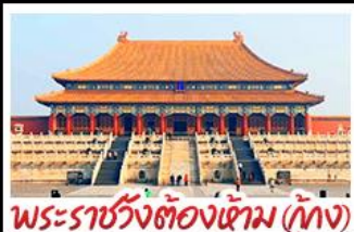
พระราชวังต้องห้าม (ปักกิ่ง)