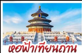
เจดีย์เทียนถาน