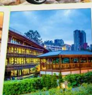
ห้องสมุดเป่ยโถว