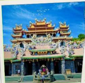
วัดกวนตู่