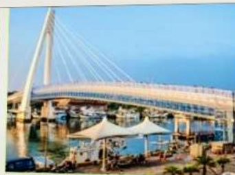
สะพานคู่รักตั้นส่วย