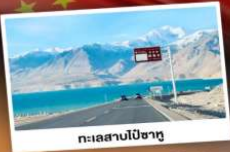
ทะเลสาบไปซาตู

“ซินเจียงใต้” ดินแดนแห่งทะเลทราย สัมผัสวัฒนธรรมของชาวซินเจียงอุยกูร์