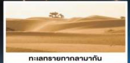
ทะเลทรายทากลามากัน