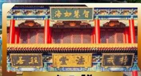
วัดจินโก้