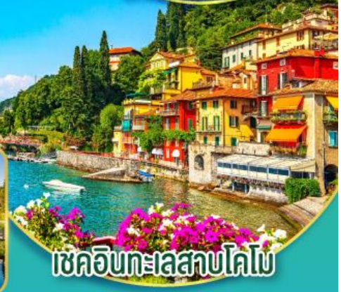
เชคอินทะเลสาบโคโม