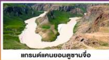
แกรนด์แคนยอนดูซานจื่อ