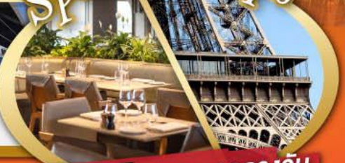
รับประทานอาหารกลางวัน บนหอไอเฟล

ไฮไลท์ในโปรแกรม • สะพานไมซ์าเปล ลูเซิร์น