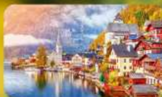
การันตีที่พัก Hallstatt / St. Wolfgang หรือริบทะเลสาบ 1 คืน