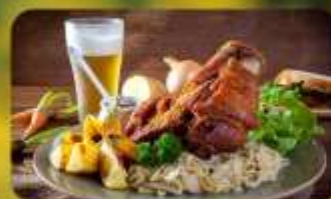
พิเศษ! ลิ้มลองเมนูประจำชาติ ทั้ง 5 ประเทศ!!!