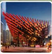
พิพิธภัณฑ์ศิลปะ-ตะเกียบ