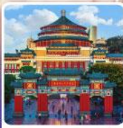
ศาลาประชาชนฉงชิ่ง