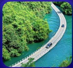
“ หุบเขาสิงโต ซื่อจื่อกวน ”