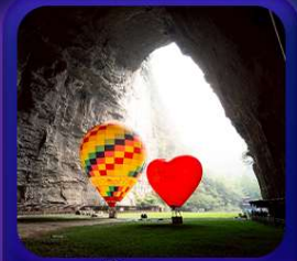
“ ถ้าถึงหลง ”