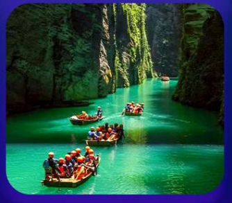
“ ผิงซานแกรนด์แคนยอน ”

เที่ยวจีน 2 มณฑล เสฉวน+หูเป่ย์ • ถ้าถึงหลง • หุบเขาสิงโต ซื่อจื่อกวน ล่องเรือมังกรกังสุ่ยชมวิวยามค่ำคืน • ผิงซานแกรนด์แคนยอน (รวมล่องเรือ) หงหยาดัง • จุดชมรถไฟฟ้าทะลุทิว • ตึกตะเกียบ • สือปาตี • หลงเหมินฮ่าว