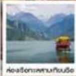
เบิ่ฮายไฮเตียน