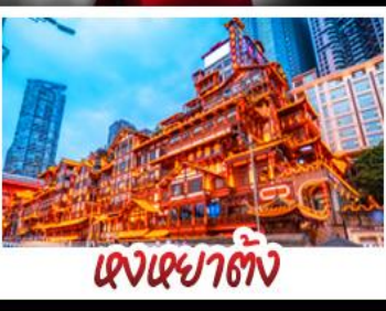
ตงเฉยฮาดัง