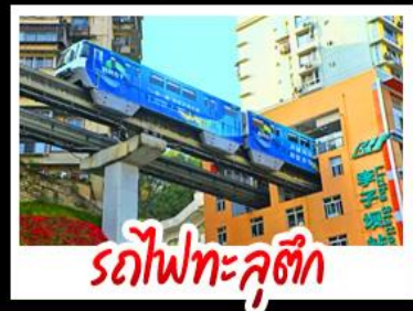
รถไฟทะลุติ๊ก