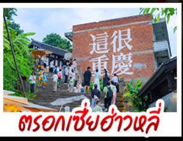
ตรอกเซี่ยฮ่าวหลี่