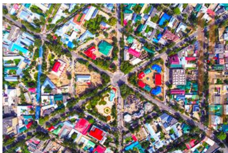
ถนนหกแฉก

จากนั้นนำท่านเดินทางสู่ เมืองอิหนิง 伊宁 (ระยะทาง 200 กม. ใช้เวลาเดินทางราว 3 ชั่วโมง)