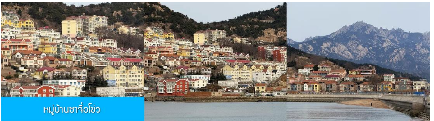
หมู่บ้านซาจื่อโขว่

เที่ยง รับประทานอาหารกลางวัน ณ ภัตตาคาร (มื้อที่ 7)