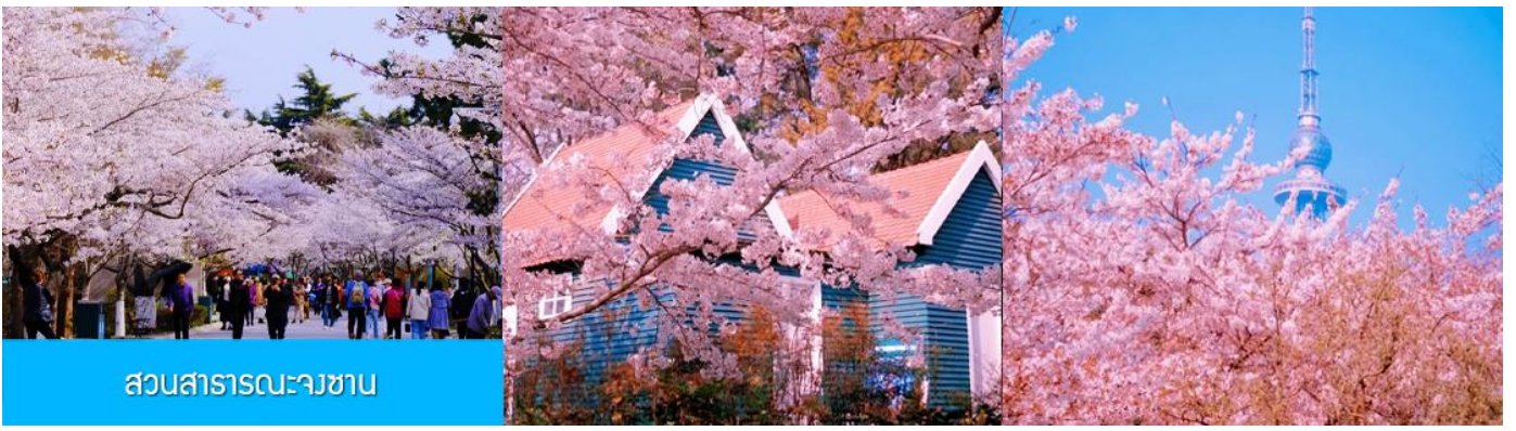
สวนสาธารณะนางซาบ

ถึงชิงเต่า นำท่านชมสวนสาธารณะจงซาน สวนจงซานได้ขึ้นชื่อว่าเป็นสวนที่ชมซากุระสวยที่สุดในเมืองชิงเต่า พอถึงช่วงดอกบาน ต้นซากุระสองข้างทางจะผลิบานพร้อมกัน กลายเป็นอุโมงค์สีชมพูขาว เดินเข้าไปในสวน แล้วบรรยากาศคือหวานละมุน และดูโรแมนติก จะบานช่วงปลายมีนา ถึง ต้นพฤษภาคม