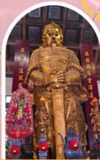
วัดแชกง ขอพรโชคลาก การเงิน และธุรกิจ