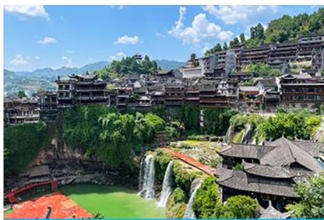
เมืองโบราณ ฝูหรงเจิ้น