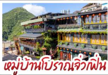
หมู่บ้านปิศาจจิ้งจิก