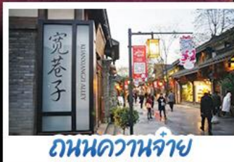
ถนนความจำ