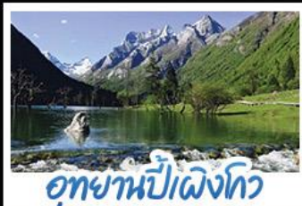
อุทยานปี่เผิงโกว

ภูเขาสัตรีณี อุทยานจิวจ้ายโกว นั่งรถไฟความเร็วสูง น้ำพุไม่ไผ่ตักSKP อุทยานปี่เผิงโกว วัดต้าฉือ ถนนโบราณชอยกวางชอยแคบ ช้อปปิ้งถนนไถ่กู่หลี่ + ถนนซุนชี่ลู่