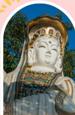
รีพลัสเบย์