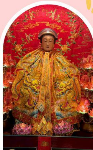
วัดหล่งโหมว

ความสำเร็จ ความมั่งคั่ง เงินทองไหลมาเทมา