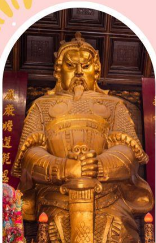
วัดเชกวง