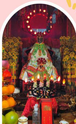
วัดเจ้าแม่กวนอิมฮ่องฮำ

ความสำเร็จ ความมั่งคั่ง เงินทองไหลมาเทมา