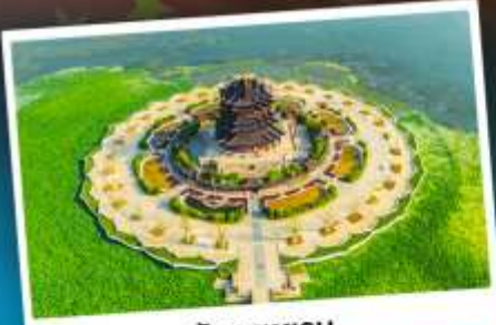
วัดคงทงวน

ล่องเรือชมป่าในน้ำทะเลสาบชิงชาน ไหว้พระใหญ่หลิงซาน เกียวมมหานครเซี่ยงไฮ้