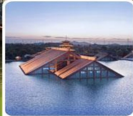
พิพิธภัณฑ์ไดน้ำ กวางฟู่หลิน