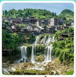
ผู้หลงจีน