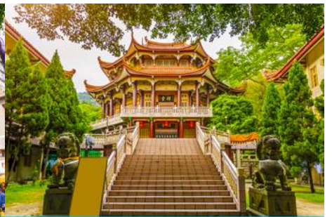
วัดหนานกัวซื่อ