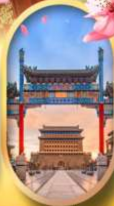
ถนนคนเดินเจียมเหมิน