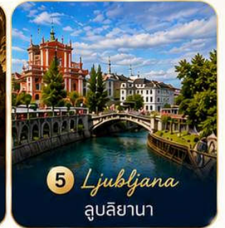
5 Ljubljana ลูบลียานา