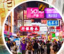
Shopping Taim Sha Tsui