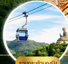
รวมกระเช้าฮ่องกง