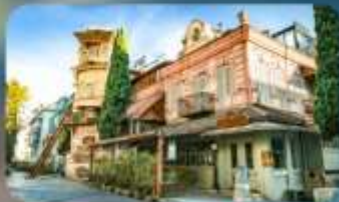
โรงละครกาเบรียลาเซ