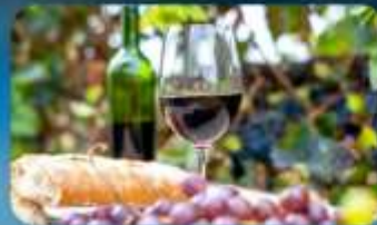
พิเศษ!! ซิมไวน์ท้องถิ่น