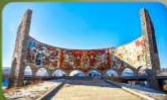
อนุสรณ์สถานริสเซีย-จอร์เจีย