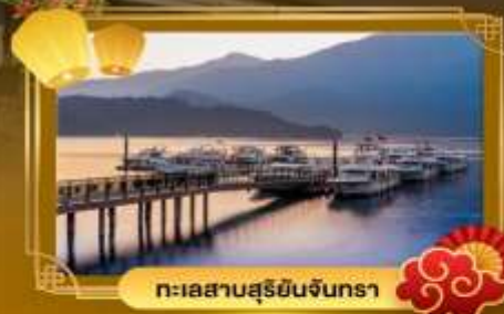
ทะเลสาบสุริยจันทร์