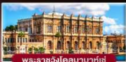
พระราชวังโดลมาบาห์เซ่

พิเศษ..พักดับปาดเทีย 2 คืน ฟรี! ไอศกรีมท่านละ 1 SCOOP