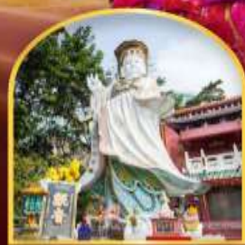
เจ้าแม่กวนอิม ฮัฟลิสมบย์ ขอพรเกี่ยวกับธุรกิจ และ การเงิน