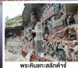
พระหินแกะสลักตำจู้