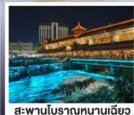
สะพานโบราณหนานเฉียว