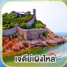
เจดีย์เฝิงโหล