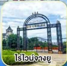
ไร่วินิจฉัยยู